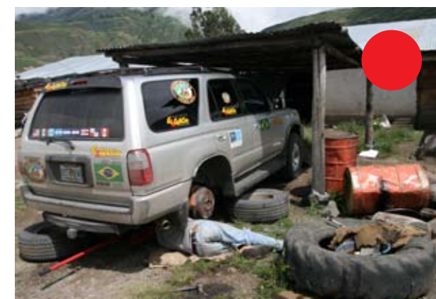
(PRIMEIRA FOTO, ABAIXO) CONSERTANDO O FREIO DA TOYOTA APÓS UM GRANDE SUSTO EM UMA RODOVIA PERIGOSA E CHEIA DE CURVAS; (AO LADO) BELAS PAISAGENS DO